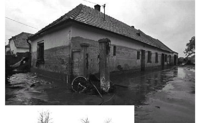
A vörösiszap károsult kolontári iskola

We also ask you to remember the United Hungarian Fund in your will.