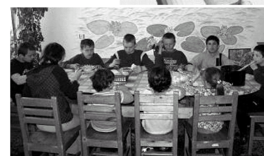
A vici Szent Anna ház gondozottjai