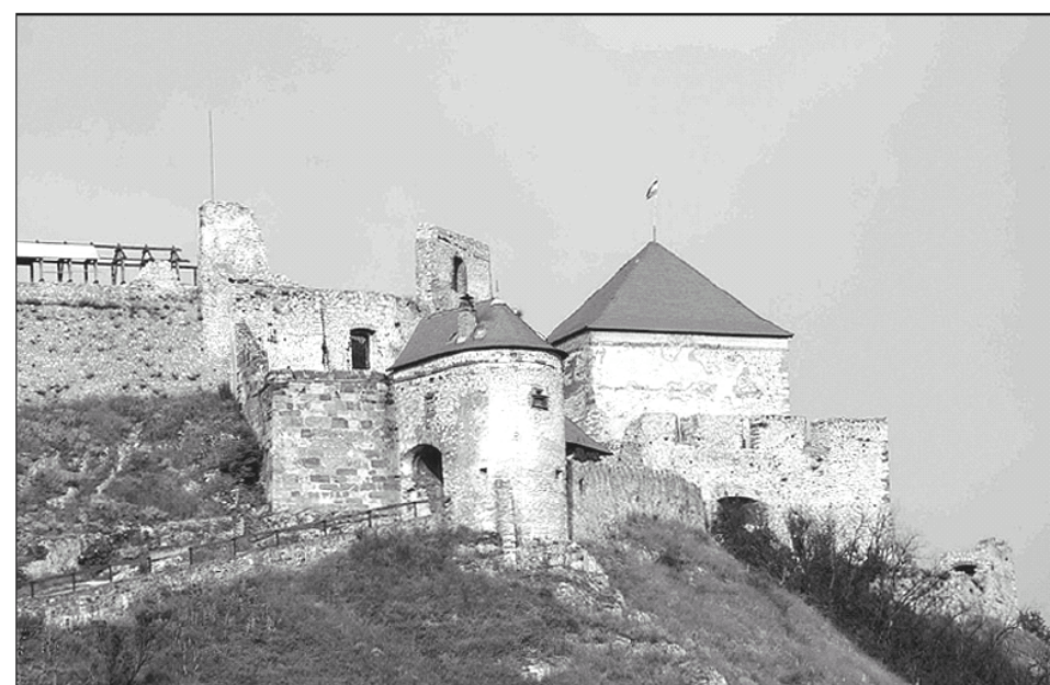
A panorámát uralja a sümegi vár festői képe

Van-e valami, ami több lehet annál, mint amikor valamelyik négycsillagos szállodában pompás étkekkel, illatos fürdőkkel, masszázsszal, szaunával, a szállodaszobában apró figyelmességekkel kényeztetik a vendéget? Igen, van. Az, amikor úgy látjuk vendégül, hogy egy gondolat, a legkedvesebb gondolatunkkal ajándékozzák meg a betérőt a vendéglátók. A sümegi vár, a sümegi Hotel Kapitány világa ilyen. Egyetlen gyönyörű gondolat a hazaszeretetről, a